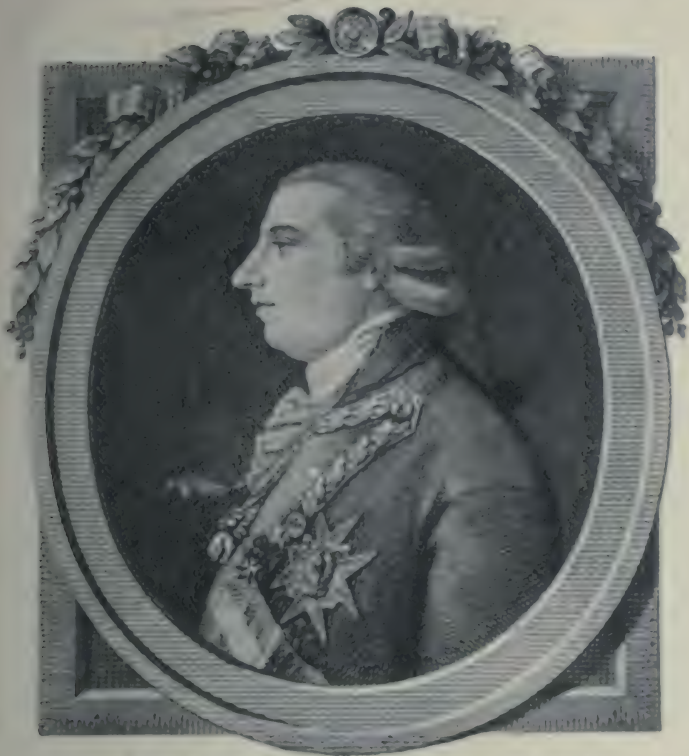
Manuel Godoy, duc de la Alcudia, prince de la Paix.

Portrait par Antonio Carnicero, grave par J. Selma. (Bibl. Nat. Estampes.)